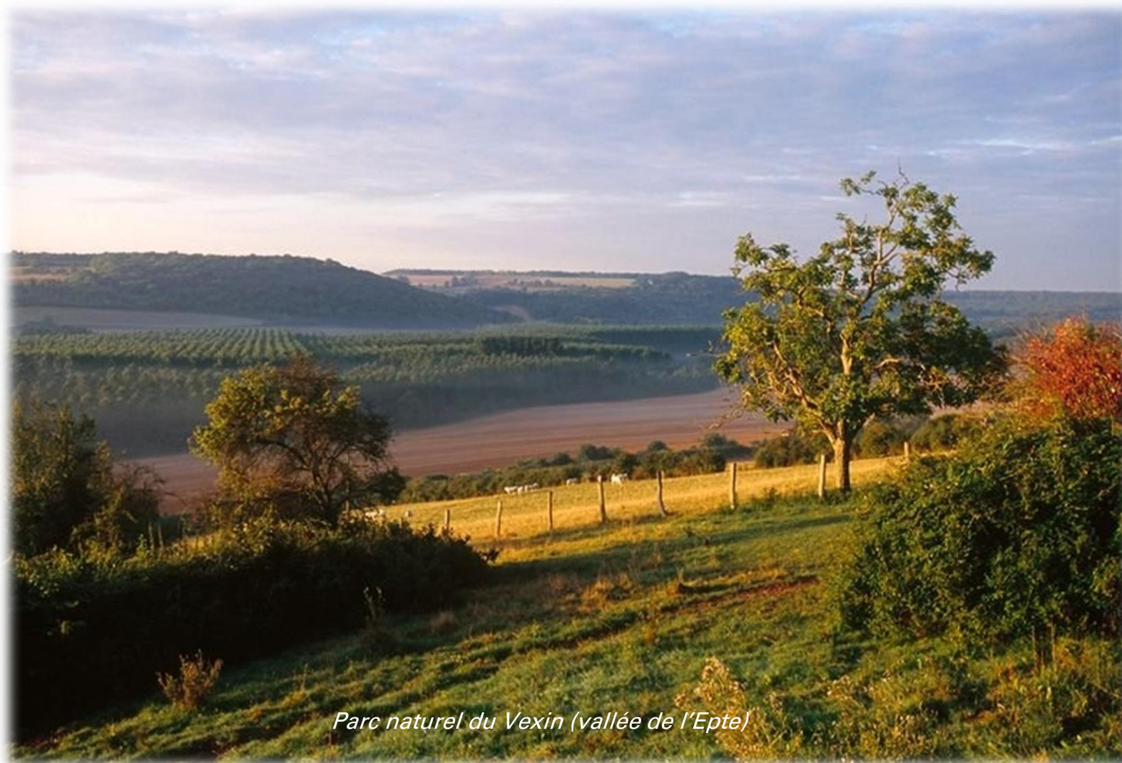
Parc naturel du Vexin (vallée de l'Epte)